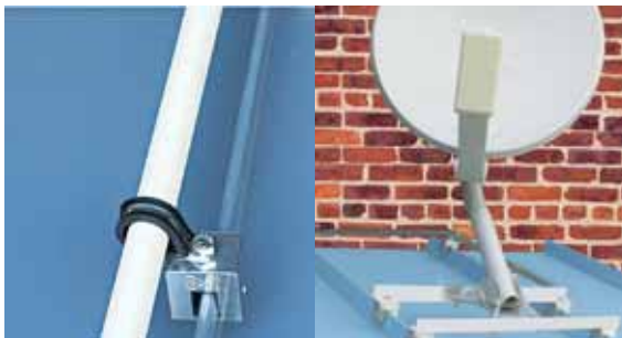
Viele weitere Anwendungsmöglichkeiten wie z. B. Kabelleitungen, Blitzschutz, Antennen, Schilder, Logos,