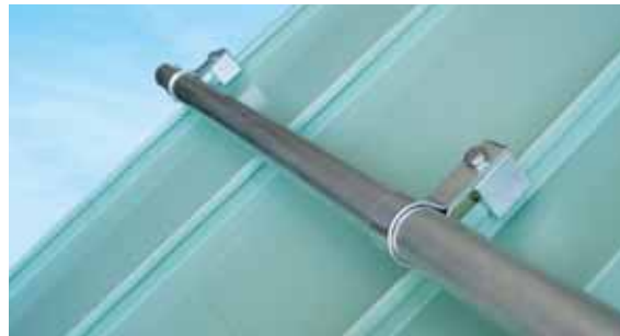
SnoGard - das preisgünstige Schneefangsystem zum Befestigen von Rohren als Schneestopper.