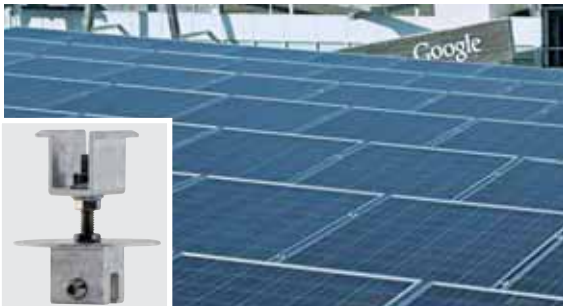
PV-Kit und Mini-Klemmen für die wirtschaftlichste Direktmontage von PV- und Solarmodulen.