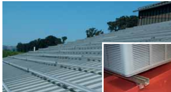
Mini-Klemmen mit Gewinde oder mit Flansch und Langloch für stabile Befestigungen von Schienensystemen und Geräten.