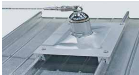
sowie Absturzsicherungssysteme, Laufroste, Luftkanäle, Abspannungen, etc. können mit den Klemmen schnell, stabil und sicher befestigt werden.