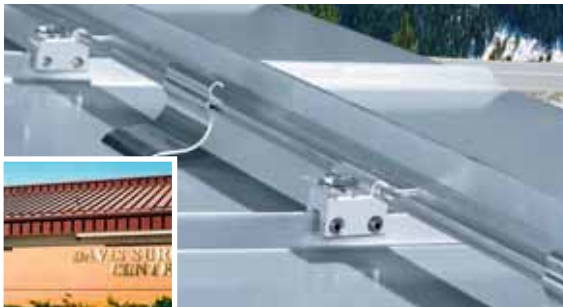
Das Schneefangsystem ColorGard kann der Farbe der Dacheindeckung ohne Farbbeschichtung angepasst werden.

Dachexperten sind sich einig: Klemmen von S-5!™ lösen das Dilemma der Befestigung von unterschiedlichsten Aufbauten auf modernen Stehfalz-Metalldächern perfekt: stabile Befestigung, keine Durchdringungen und einfache Montage. Die patentierten Klemmen bieten Verlässlichkeit, Dauerhaftigkeit und höchste Haltekräfte, die von anderen Befestigungssystemen nicht erreicht werden.